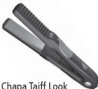
Chapa Taiff Look