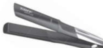
Chapa Taiff Saffira