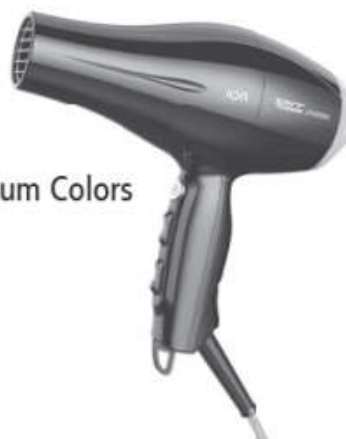
Secador Taiff Titanium Colors