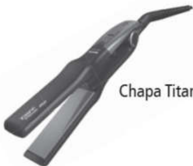
Chapa Titanium 450