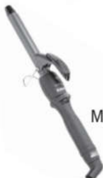
Modelador Tourmaline Ion 3'4

Este produto não é brinquedo, mantenha-o fora do alcance de crianças.