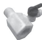
Adaptador 1/2" com registro